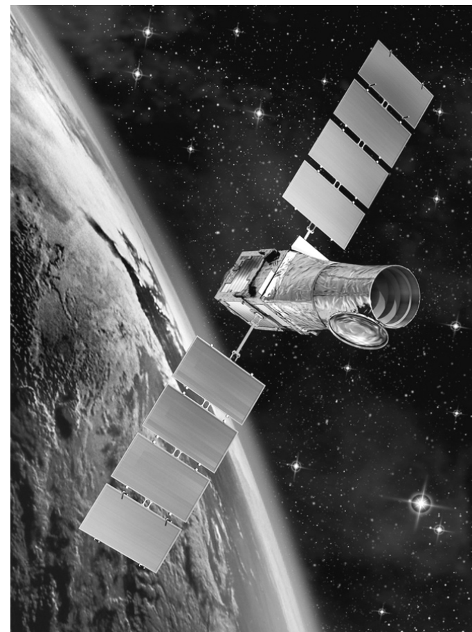
Evropská družice COROT, jejíž start je naplánován na 21. 12. 2006.