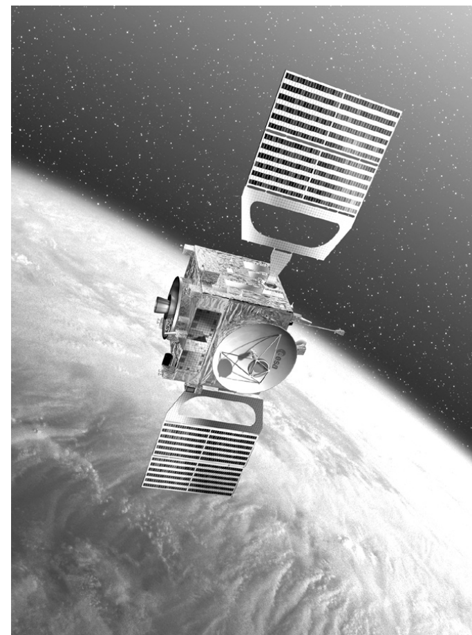
Evropská sonda VENUS EXPRESS byla 11. dubna 2006 navedena na oběžnou dráhu kolem planety Venuše.

Tisk: Trikolora s. r. o. Valašské Meziříčí